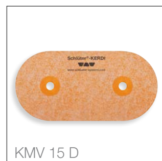
KMV 15 D