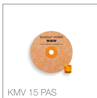
KMV 15 PAS