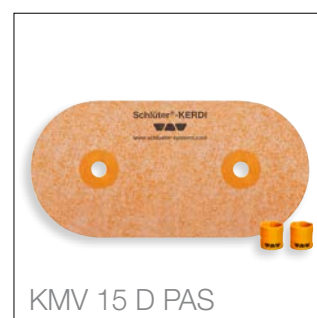
KMV 15 D PAS